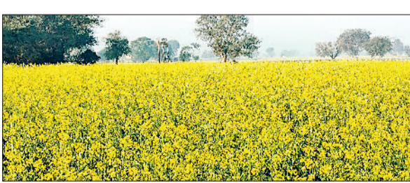
रेवाड़ी। एक किसान के खेत में सरसों की फसल पर छाए पीले फूल।

दिसंबर माह के बीस दिन बीत जाने के बाद ठंड पीक पर आने लगी है। पहली बार न्यूनतम तापमान 5 डिग्री सेल्सियस से नीचे आया है, जिससे मंगलवार की रात सौजन की सबसे ठंडी रात रही। दोपहर बाद आसमान में आंशिक बादल छाने से अब कोहरा पड़ने की संभावना बढ़ गई है। अगले तीन से चार दिन आसमान में आंशिक बादल छाए रहने के