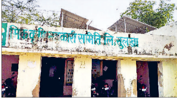
रेवाड़ी। सुलखा पैक्स जहां जन औषधी केंद्र खोला जाना है।

केंद्रीय सहायकारिता मंत्री अमित शाह ने पैक्स की आय बढ़ाने के लिए तेजी से इनके इन्कम सॉर्स