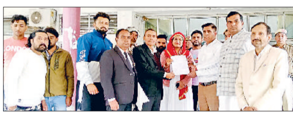
रेवाड़ी। डीआरओ को ज्ञापन सौंपते जाट समाज के लोग।