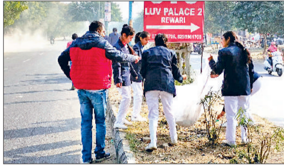
रेवाड़ी। सफाई करते हुए विद्यार्थी व कर्मचारी।