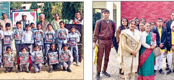
रेवाड़ी। विजेता प्रतिभागी शिक्षकों के साथ।

अनियमित कॉलोनीयों को नियमित करने के लिए आरडब्ल्यू या कॉलोनाइजर्स के माध्यम से आवेदन करने के निर्देश जारी किए गए थे। डीटीपी को बड़ी संख्या में कॉलोनीयों को नियमित कराने के आवेदन मिले थे, परंतु सरकार के नियमों पर खरा उतरने वाली कॉलोनीयों की संख्या कम रही थी।