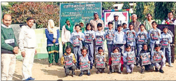
रेवाड़ी। विद्यार्थियों को स्वेटर वितरित करते हुए।

सरकार की ओर से नगर परिषद की सीमा में आने वाली पांच और बावल नपा की सीमा में आने वाली तीन कॉलोनीयों के माथे से 'अवैध' का कलंक हटा दिया है। इन कॉलोनीयों से पहले अगस्त माह में रेवाड़ी डीटीपी एरिया की 14 और धारूहेड़ा नपा की सीमा में 7 कॉलोनीयों को नियमित किया था। अभी भी पांच दर्जन से अधिक कॉलोनीयों को नियमित किए जाने की दरकार है। सरकार की ओर से गत वर्ष