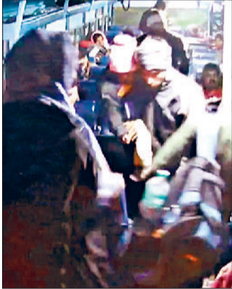
धारुहेड़ा। सीसीटीवी कैमरे में बैग ले जाते नजर आ रहा एक यात्री।

राजस्थान रोडवेज की बस में गुरुग्राम से बावल जा रहे एक बस यात्री का जेवरात व अन्य सामान से भरा बैग चोरी हो गया। बस में लगे सीसीटीवी में नजर आया चोरी का आरोपी