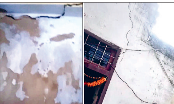
बावल। शाहपुर की बीपीएल कॉलोनी के मकानों में आई दरारें।