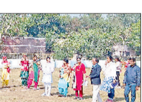
रेवाड़ी। मटकी दौड़ में भाग लेती महिलाएं।