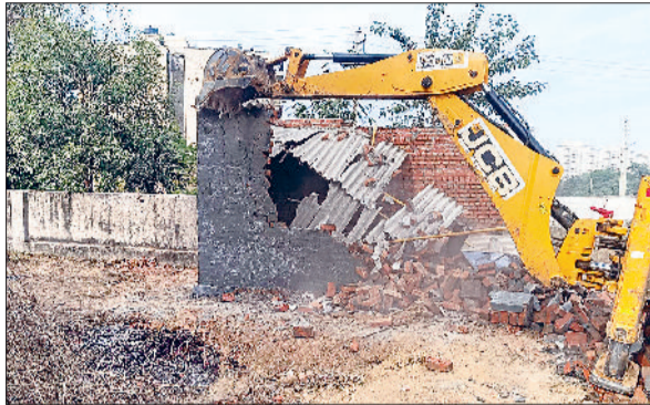
रेवाड़ी। डवाना में अवैध कॉलोनी में निर्माण तोड़ते डीटीपी की जेसीबी।